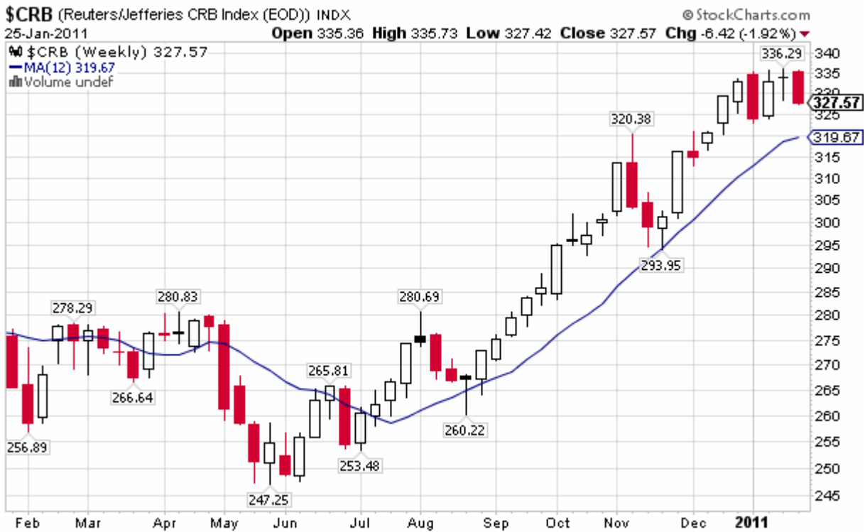
Abb. 6: CRB-Rohstoffindex am 25. Januar 2011 (Wochenkerzen)

sich bei Redaktionsschluss (26. Januar für Rohöl) auf etwa 96 USD/Barrel. Auf diesem Niveau haben sich die Futurespreise für alle Termine des kommenden Jahres eingependelt. Der Dezembertermin notiert nur leicht höher bei etwa 97 USD/Barrel.