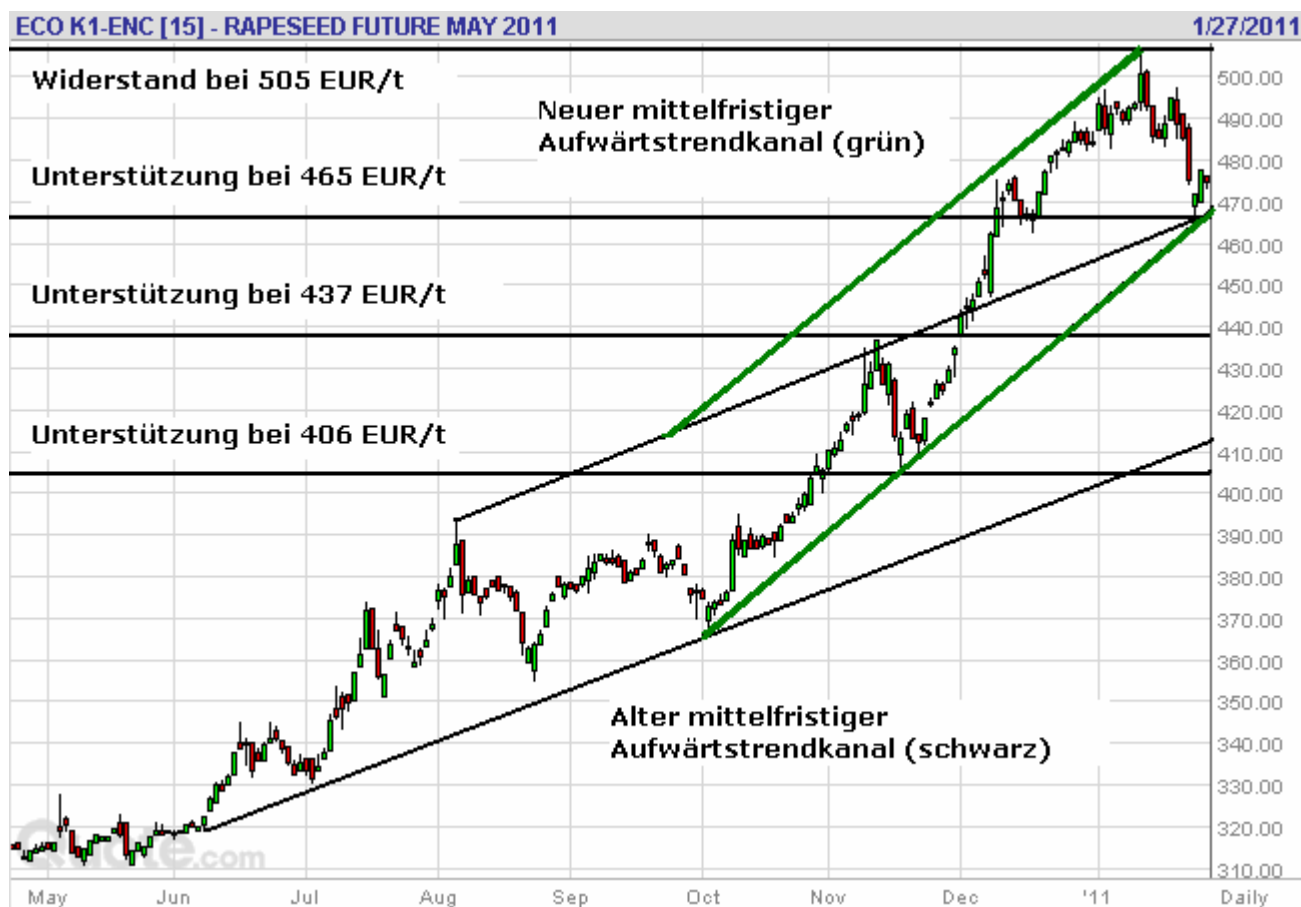
Abb. 4: Raps-Futurekontrakt Mai 2011 an der Pariser Matif am 27. Januar 2011 (Tageskerzen)

Fundamentaldaten: Das US-Landwirtschaftsministerium rechnet mit deutlichen Abbau der weltweiten Lagerbestände bei Rapssaaten (- 24 %). Für die EU-27 prognostiziert das Ministerium einen Rückgang der Endbestände um 1,0 Mio. t auf 0,9 Mio. t. Dies wäre ein Minus von etwa 54 % und