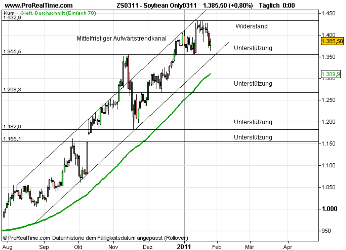
Abb. 3: Sojabohnen-Future März 2011 an der Chicagoer CME am 27. Januar 2011 (Tageskerzen, elektronischer Handel)

Das US-Landwirtschaftsministerium prognostiziert in seiner Schätzung vom 12. Januar 2011 eine weltweite Sojabohnenernte in Höhe von etwa 256 Mio. t. Dies wären rund 2 % weniger als im Vorjahr. Darin enthalten ist ein trockenheitsbedingter Abschlag für die argentinische Ernte in Höhe von 1,5 Mio. t bezogen auf die Vormonatsschätzung. Dagegen sei ein um gut 7 % höherer weltweiter Verbrauch zu erwarten. Damit entspricht die erwartete Erntemenge der Höhe des Verbrauchs. Im vergangenen Jahr lag die Erzeugung noch fast 22 Mio. t über dem Verbrauch. Die weltweiten Endbestände veranschlagt das Ministerium auf nur noch 58 Mio. t. Dies wären etwa 2 Mio. t weniger als im vergangenen Jahr. Die Prognose für die US-Endbestände fällt erneut recht mager aus. Preisstützend dürfte der Pflanzenöl-Markt wirken: Das Verhältnis der Lagermengen zum Verbrauch schätzt das USDA mit kaum 7 % als sehr niedrig ein: Im Wirtschaftsjahr 2008/09 lag das Stocks-to-Use-Verhältnis bei etwa 10 %. Ursache sei die rege Nachfrage des Lebensmittelsektors.