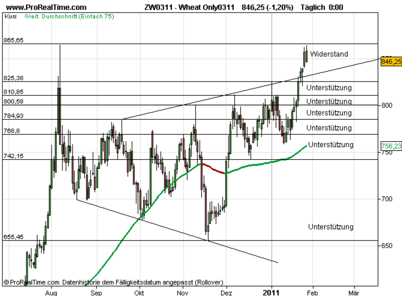
Abb. 1: Weizenfuture März 2011 in Chicago am 27. Januar 2011 (elektronischer Handel, Tageskerzen)

vergangenen 15 Jahre ergibt, lässt sinkende Kurse allerdings erst ab März bis Juni erwarten. Die Gegenposition halten die „Large Traders“ (Fonds, Banken): Sie setzen per Saldo auf weitere Kursgewinne.