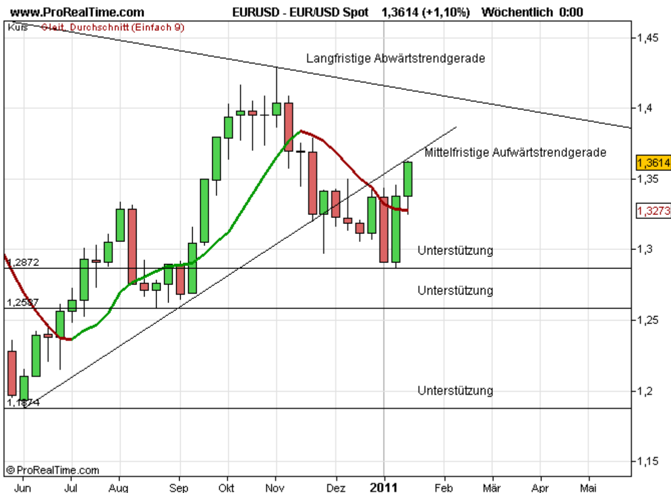
Abb. 7: USD/EUR vom 21. Januar 2011 (Spot-Kurse, Wochenchart)