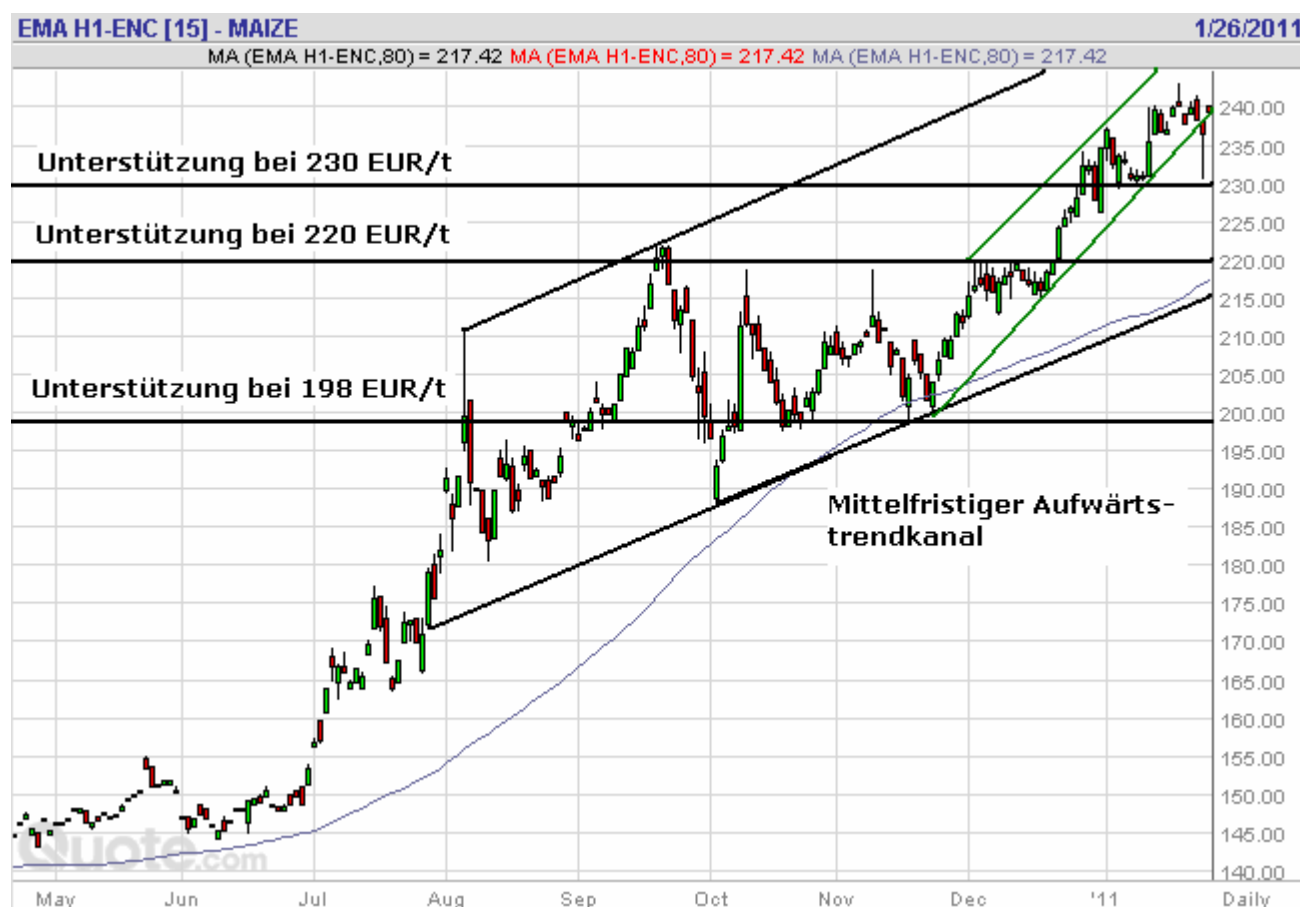
Abb. 5: Körnermais-Futurekontrakt März 2011 an der Pariser Matif, 26. Januar 2011 (Tageskerzen)

Fundamentaldaten: Der Getreiderat IGC verzeichnet eine steigende EU-Importnachfrage. Die EU-Kommission geht in ihrer aktuellen Prognose davon aus, dass die EU-27-Maisernte im Jahr 2011 mit 58,8 Mio. t um gut 3 % höher ausfällt als die alte Ernte. Zuwächse werden vor allem in den größten Erzeugerländern Frankreich (+16 %) und Deutschland (+ 7 % erwartet. Einen kräftigen Einbruch in Höhe von etwa 10 % erwartet die Kommission dagegen in Rumänien. Die aktuelle USDA-Prognose für die EU-27 enthielt nur geringfügige Korrekturen im Vergleich zur Vormonatsschätzung.